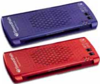
SuperSlim Series A4