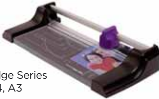
Edge Series A4, A3