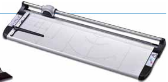
Elite Series A4, A3, A2, A1