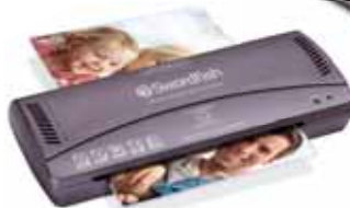
Compact Series A4, A3